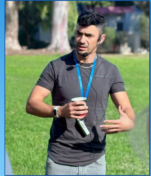
Nawad berichtet vom dramatischen Überlebenskampf der Menschen im Kibbutz NAHAL OZ am 07. Oktober 2023.