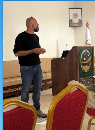
Angehöriger einer drusischen Gemeinde im Norden Israels