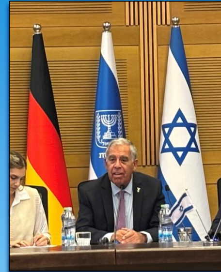
Oppositionsführer Mickey LEVY (Jesch ´Atid – dt. ‚Es gibt eine Zukunft‘)