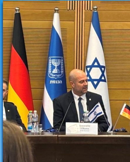
Der Sprecher des israelischen Parlaments (Knesset) Amir OHANA (Likud-Partei)