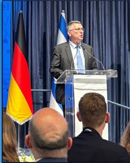
Der israelische Außenminister Gideon SA´AR (Likud-Partei)