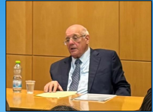
Richter Hanan MELCER, emeritierter Präsident des Obersten Gerichtshofs