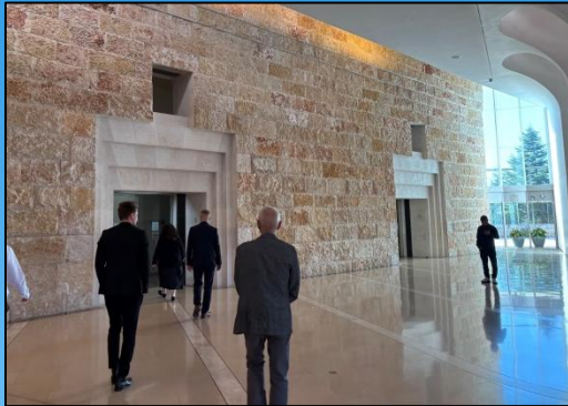
Besuch des Obersten Gerichtshofes des Staates Israel