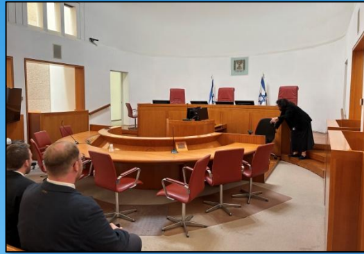
Einblicke in die Gerichtssäle