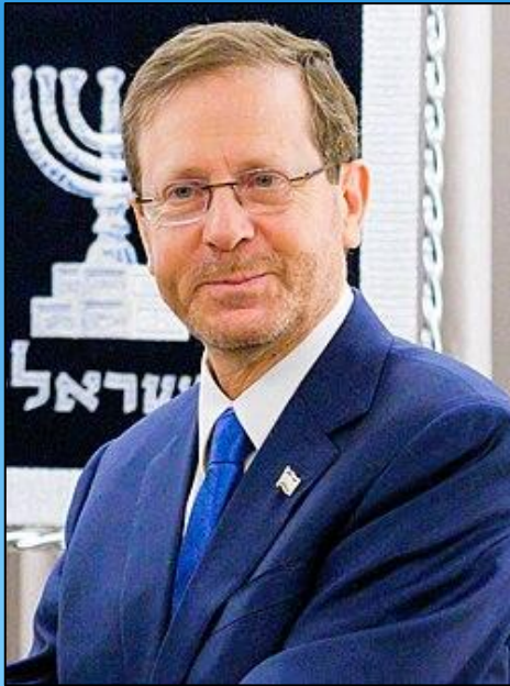
Jitzchak „Bougie“ Herzog

– Besuch des Amtssitzes des Präsidenten des Staates Israel –