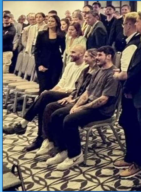
Drei Überlebende des NOVA Music-Festivals nach der Aufführung des Dokumentarfilms „We Will Dance Again“ im Hotel in Tel Aviv